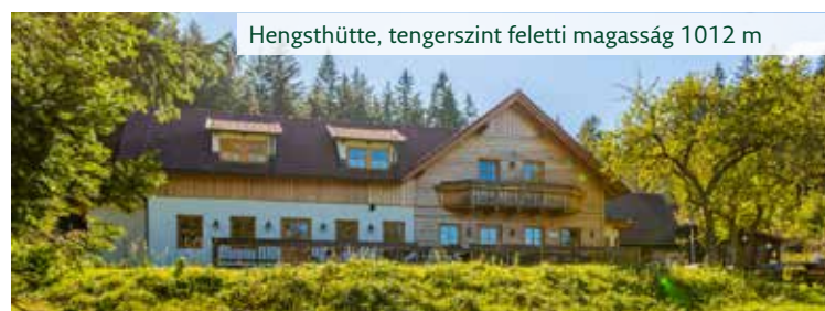
Hengsthütte, tengerszint feletti magasság 1012 m

A családbarátság és a magas életminőség elengedhetetlen az alsó-ausztriaiak jóllétéhez. Ez magában foglalja a megbízható és biztonságos utat a munkába vagy az iskolába, valamint a pihenés és kikapcsolódás helyére való kényelmes eljutást. A Niederösterreich Bahnen mindezt lehetővé teszi – pontossággal, megbízhatósággal és utaskényelemmel, valamint a részletekre való nagy odafigyeléssel kombinálva. Hat vasútvonal és két hegyi vasút kínálja a professzionális, mindennapi és szabadidős szolgáltatások igényorientált keverékét, és mutatja be hazánkat, Alsó-Ausztriát annak legszebb oldaláról. Merüljön el az Alsó-Ausztriai Vasutak világában, jó utat kívánok.