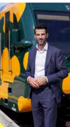
Udo Landbauer Alsó-Ausztria közlekedési minisztere Kormányzóhelyettes

A családbarátság és a magas életminőség elengedhetetlen az alsó-ausztriaiak jóllétéhez. Ez magában foglalja a megbízható és biztonságos utat a munkába vagy az iskolába, valamint a pihenés és kikapcsolódás helyére való kényelmes eljutást. A Niederösterreich Bahnen mindezt lehetővé teszi – pontossággal, megbízhatósággal és utaskényelemmel, valamint a részletekre való nagy odafigyeléssel kombinálva. Hat vasútvonal és két hegyi vasút kínálja a professzionális, mindennapi és szabadidős szolgáltatások igényorientált keverékét, és mutatja be hazánkat, Alsó-Ausztriát annak legszebb oldaláról. Merüljön el az Alsó-Ausztriai Vasutak világában, jó utat kívánok.